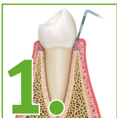
Gesunder Zahn, frei von Belägen.