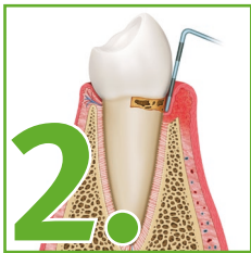
Leichte Entzündung am Zahnfleisch durch Beläge und Zahnstein.