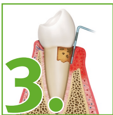
Fortgeschrittene Entzündung des Zahnfleisches und Zahnhalteapparats durch Beläge und Zahnstein.